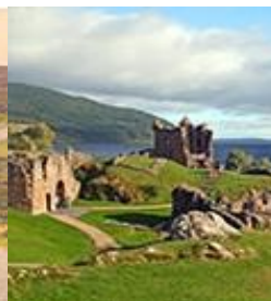
尼斯湖岸边的城堡