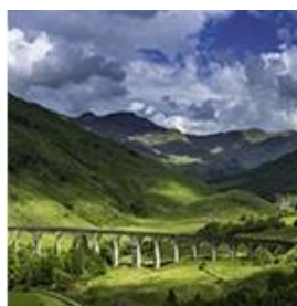
霍格沃兹特快列车铁路

苏格兰在 2017 年被 Rough Guide 的读者评选为世界上最美丽的国家。苏格兰有高地，有海岸线，有岛屿。我们的国际学生社团也会组织活动去苏格兰不同的地方游玩。